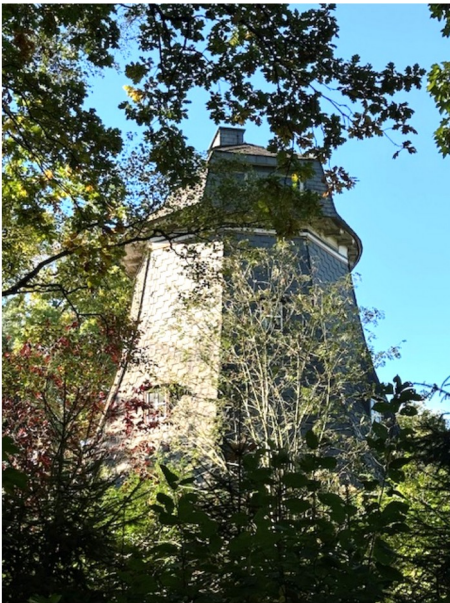
Bild 12: Wedeler Mühle „Helga“, An der Windmühle 15 in 22880 Wedel

Frage 2: Wie heißt der Platz gegenüber der Wassermühle?