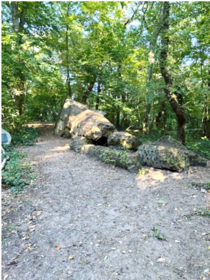
Bild 5: Dampfmühlen-Ruine, Langes Tannen, Heidgrabener Straße 1 in 25436 Uetersen

Langes Tannen ist ein weitläufiges Parkgelände im Norden von Uetersen. Auf einem Hügel im Park liegt dieser gesprengte Schornstein der Dampfmühle „Lange“. Die Antworten finden Sie auf der Tafel / Findling links davon.