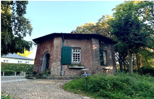
Bild 6: Langes Mühle, Langes Tannen, Neue Mühle 5 in 25436 Uetersen

Frage 2: Wann wurde der gesprengte Schornstein zum Kulturdenkmal?