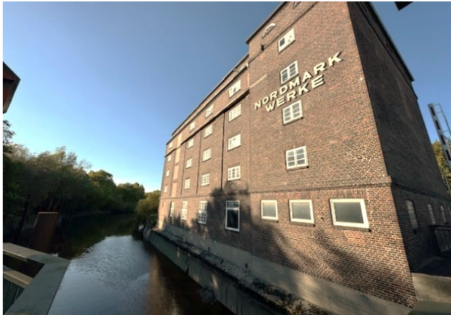
Bild 7: Bauernmühle am Pinnahafen, Pinnuallee 2 in 25436 Uetersen

Direkt bei der Klappbrücke Uetersen-Moorrege steht diese Industriemühle an der Pinnau. Eine gute Parkmöglichkeit bietet der Parkplatz von Lidl, nur 250 m entfernt. Bauherr dieser in 1928 erbauten Mühle war der Schleswig-Holsteinische Bauernverein.